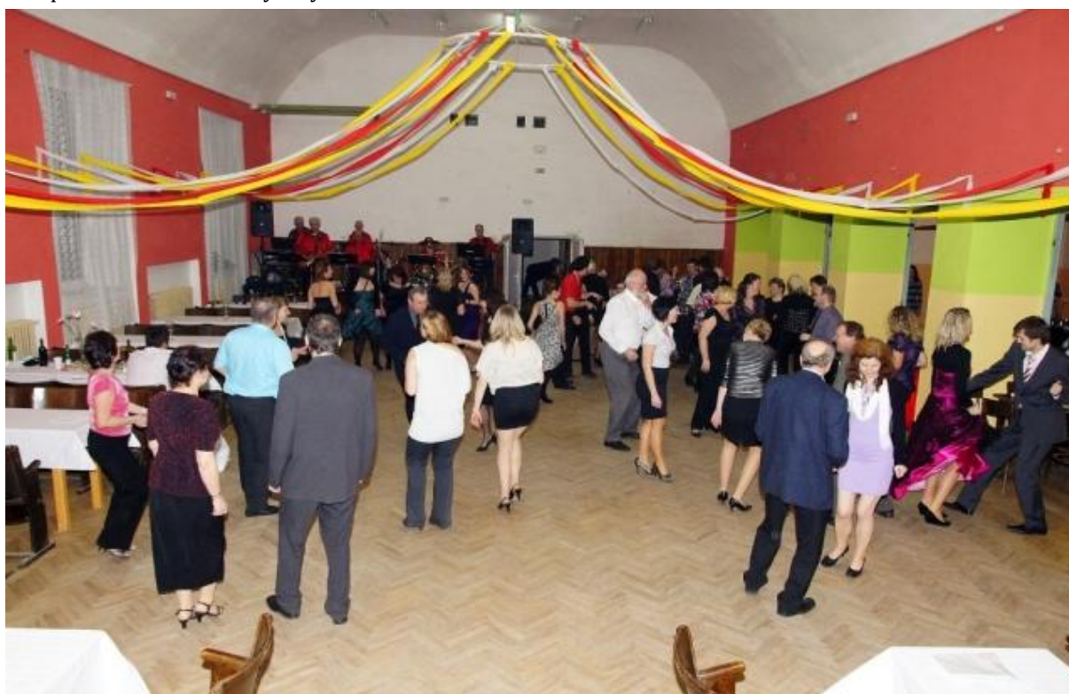
Obrázek 3: Ples

Ve spolupráci s Českým zahrádkářským svazem jsme koncem ledna 2013 zorganizovali ples, v programu plesu bylo předtančení, každá platící žena dostala u vstupu kytičku. Plesu se zúčastnilo přibližně pouze 105 platících i tak to ale byla vydařená akce.