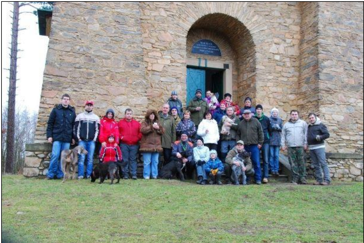
Obrázek 1: Novoroční výstup na Babylon II.

Začátkem roku 2012 se nám v duchu sokolské tradice „Výstup na nejvyšší vrcholy“ podařilo zorganizovat první ročník novoročního výstupu na rozhlednu Babylon, na tuto akci jsme navázali druhým ročníkem začátkem ledna 2013. Druhého ročníku se zúčastnilo přibližně 25 osob, opět byl k dispozici horký čaj a oheň pro opečení buřtů. Pro zájemce o pohled na zimní krajinu (bohužel bez sněhu) byla otevřena rozhledna.