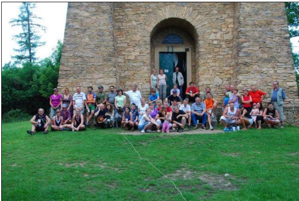
Obrázek 2: Se Sokolem na rozhledny II.

Ve spolupráci s Českým zahrádkářským svazem jsme koncem ledna 2013 zorganizovali ples, v programu plesu bylo předtančení, každá platící žena dostala u vstupu kytičku. Plesu se zúčastnilo přibližně pouze 105 platících i tak to ale byla vydařená akce.